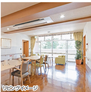
リビングイメージ

お食事はもちろん、同じフロアの方との交流のほか、レクリエーションなどをお楽しみください